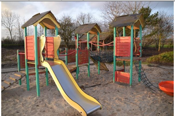
Redskab: Klatrestativ med rutsjebane Årgang: 2001 Producent: Hags Er redskabet mærket: Ja Er der registreret fejl/mangler: Ja