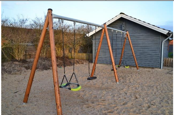
Redskab: Gyngestativ Årgang: 2019 Producent: Er redskabet mærket: Nej Er der registreret fejl/mangler: Ja