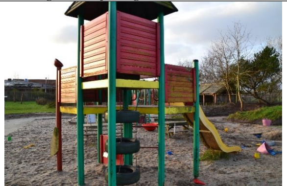
Redskab: Klatrestativ med rutsjebane Årgang: 2001 Producent: Hags Er redskabet mærket: Ja Er der registreret fejl/mangler: Ja