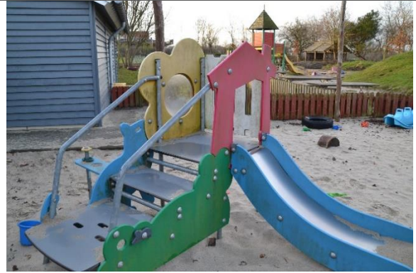
Redskab: Klatrestativ med rutsjebane Årgang: 2012 Producent: Kompan Er redskabet mærket: Ja Er der registreret fejl/mangler: Ja