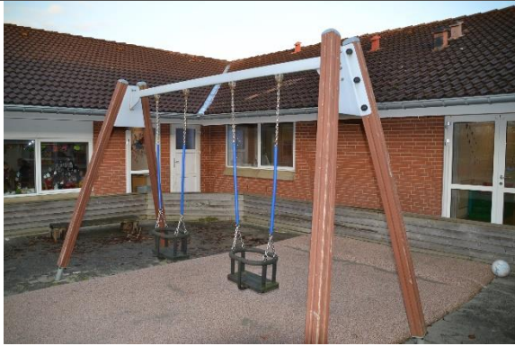
Redskab: Gyngestativ Årgang: 2012 Producent: Er redskabet mærket: Nej Er der registreret fejl/mangler: Nej