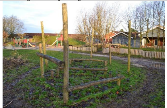
Redskab: Balancegang Årgang: 2013 Producent: Nikostine Er redskabet mærket: Ja Er der registreret fejl/mangler: Ja